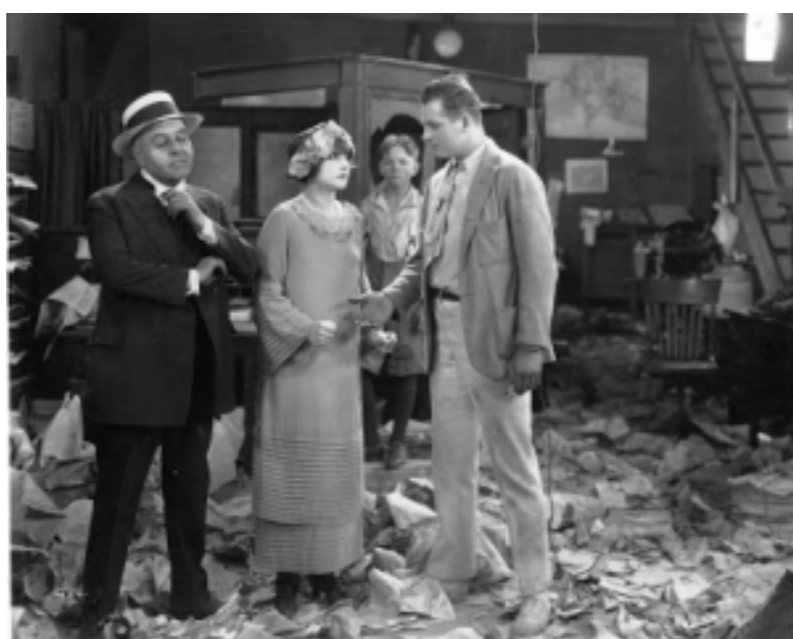
The Reckless Age © Park Circus

Pour commencer l'année 2019, la Fondation Jérôme Seydoux-Pathé célèbre les débuts de l'un des plus vieux studios de production et de distribution américain: les studios Universal .